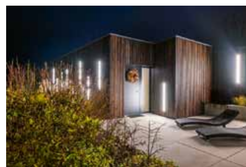
Na večerní LED osvětlení na fasádě objektu jsou použity stejné LED prvky jako na osvětlení v zahradě