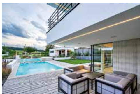
Objekt relaxu v návaznosti na bazénu a stávající rodinný dům

Autor: Ing. arch. Martin Kareš, Ph.D., MBA, spolaautor Tomáš Kupský, ateliér KAREŠ ARCH, www.karesarch.cz