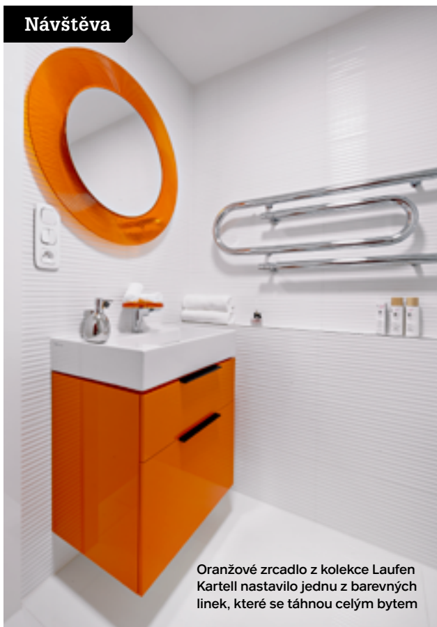
Oranžové zrcadlo z kolekce Laufen Kartell nastavilo jednu z barevných linek, které se táhnou celým bytem