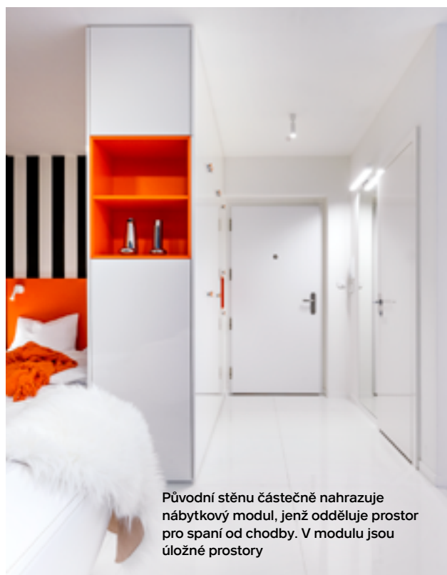
Původní stěnu částečně nahrazuje nábytkový modul, jenž odděluje prostor pro spaní od chodby. V modulu jsou úložné prostory